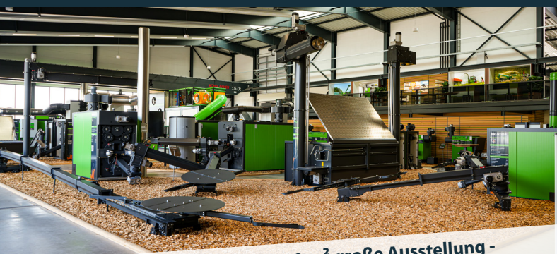
- HEIZOMAT-WELT - 3.500 m 2 große Ausstellung -

Vorträge über Heiztechnik, Förderprogramme und Wärmenetze der Zukunft