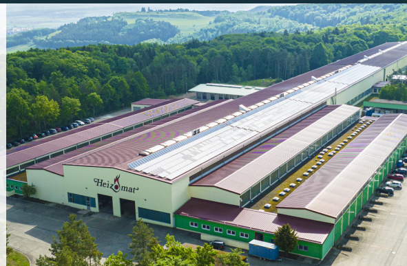
Werk II - Heidenheim

Geführte Besichtigungen der Standorte Maicha und Heidenheim, inklusive Busshuttle. Erleben Sie echtes MADE IN GERMANY auf 38.000 m 2 Produktionsfläche (Nur nach Anmeldung).