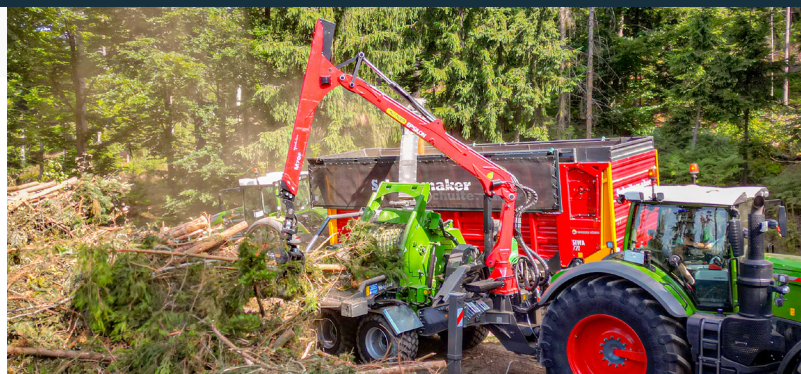
hand- und kranbeschickte Hackmaschinen von Ø 300 - 800 mm