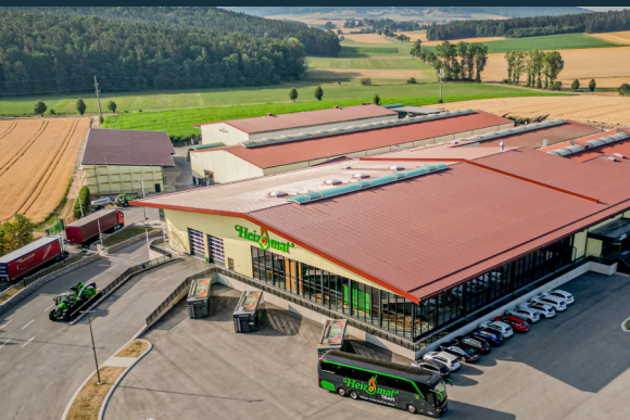
Werk I - Maicha